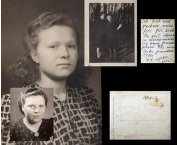
Foto's van Russinnen die ook in de fabriek van Arado werkten als dwangarbeiders.