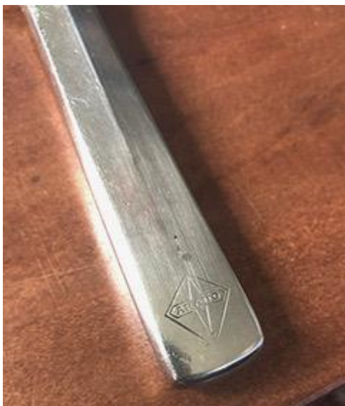
Bestek met Arado logo.