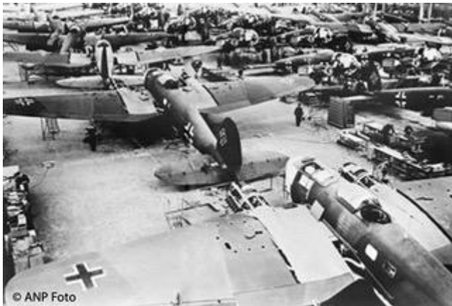
De Arado vliegtuig-fabriek in Warnemünde bij Rostock aan de Oostzee.

Uiteindelijk kwamen ze terecht in de badplaats Warnemünde bij Rostock aan de Oostzee. Ze werden tewerkgesteld in de vliegtuigfabriek van Arado ( https://nl.wikipedia.org/wiki/Arado ) en ondergebracht in barakken.